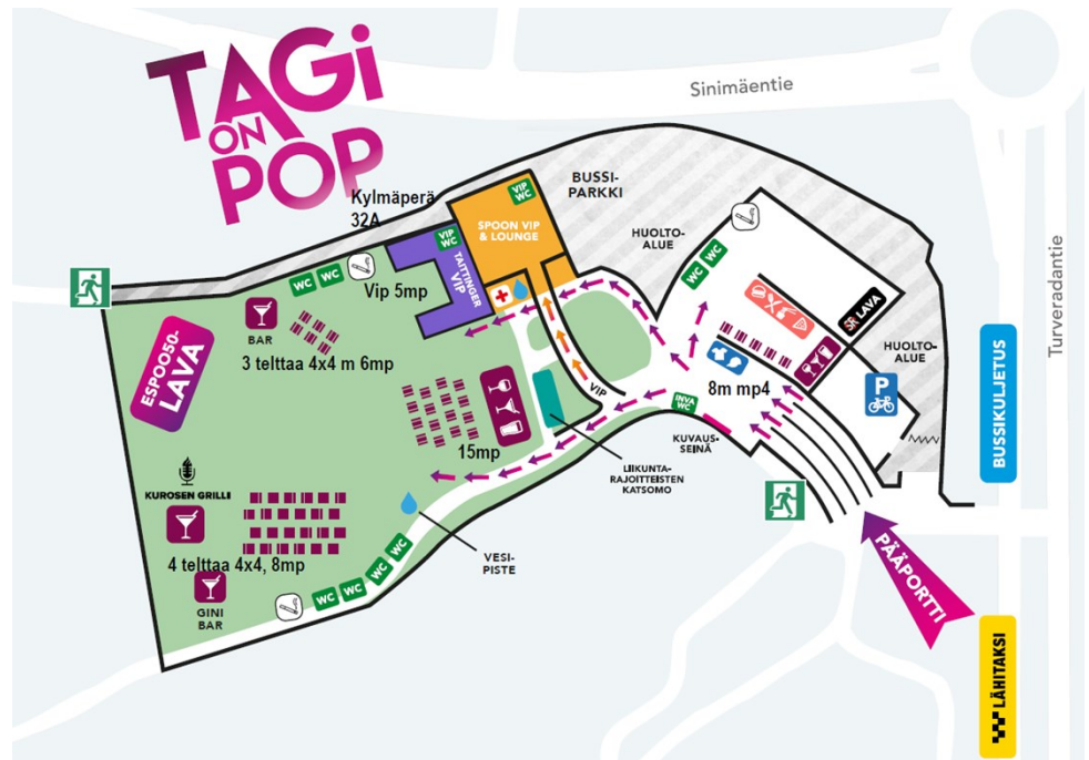
Kuva 3. Tapahtumajärjestäjän laatima tapahtuma-alueen karttakuva selitteineen. Päälava on tapahtuma-alueen länsipäädyssä ja pienempi SR-lava alueen itäpäädyssä.