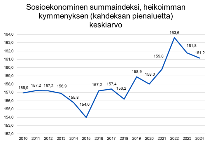
Kaavio 2: Sosioekonominen summaindeksi

Sosioekonominen summaindeksi lasketaan pienalueiden koulutusaste-, tulokvintiili- sekä työttömyystiedoista. Se auttaa tunnistamaan sosioekonomisesti keskitasoa heikommalla alueella sekä heikoimpaan kymmenykseen sijoittuvien pienalueiden tilanteen kehityksen suhteessa kaupungin keskitasoon. Heikoimman kymmenyksen indeksin kasvu kertoo siitä, että sosioekonominen ero koko kaupungin keskitasoon (=100) kasvaa. (Espoon kaupunki, Tutkimus ja tilastot; Aineistolähde: Tilastokeskus).