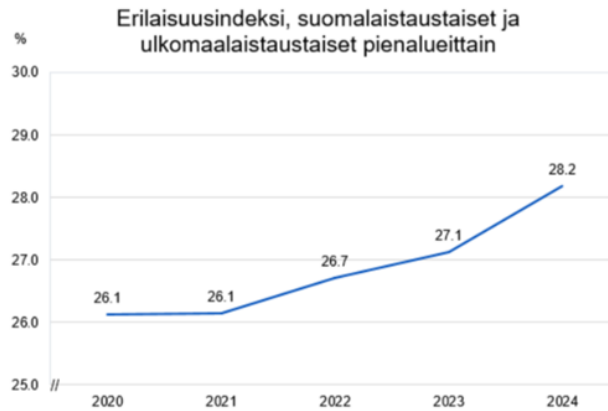
Kaavio 1 Erilaisuusindeksi Espoossa

Statusindeksi tiivistää tulo- ja koulutuserojen sekä maahanmuuton heijastumista alueelliseen kehitykseen yhdeksi neljän muuttujan indeksiksi: vain peruskoulun käyneiden osuus, työttömien osuus työvoimasta, tulotaso ja vieraskielisten osuus. Indeksillä kuvaa ainoastaan pienalueiden keskinäistä järjestystä eli niiden sisällä erot voivat olla suuria. Vuoden 2023 tarkastelussa korkeimman statuksen alueet ovat pääasiassa eteläisen Espoon pientalovaltaisista alueita. Statukseltaan keskimääräistä matalampia alueita ovat kaupunkikeskusten ympäristöt Tapiolaa lukuun ottamatta sekä rantaradan varsi. Minkään statusluokan alueet eivät kuitenkaan ole keskittyneet tietylle alueelle Espoossa.