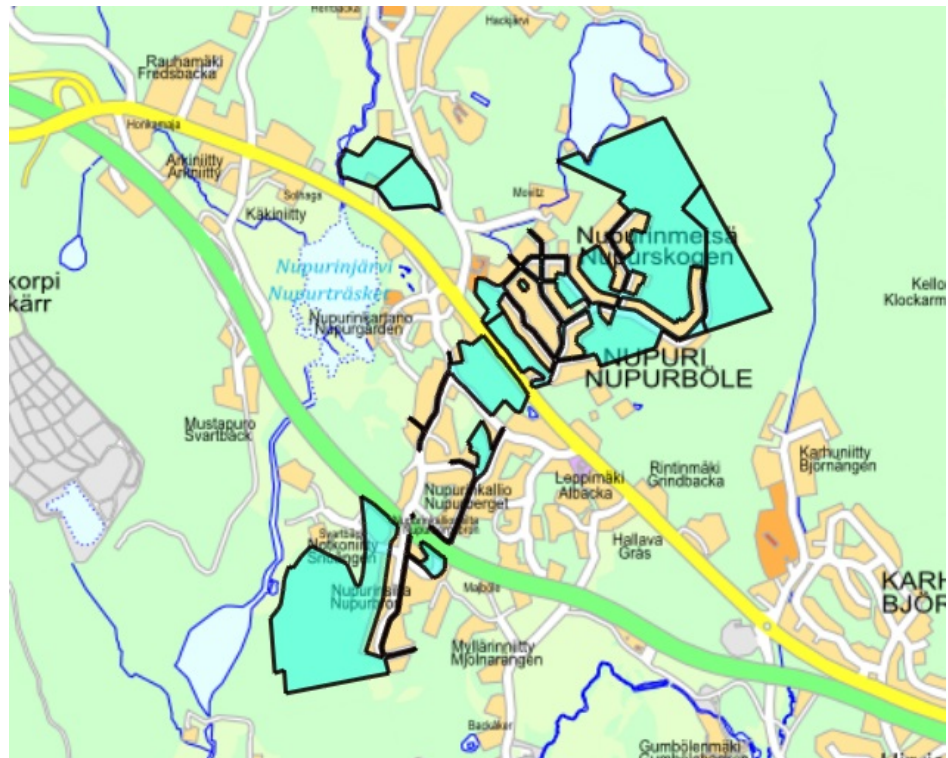
Kuva 1 ostettavat kiinteistöt turkoosilla korostettuina opaskartalla

Kiinteistöjen kokonaispinta-ala on noin 87,4 hehtaaria. Alueella on voimassa Espoon pohjois- ja keskiosien yleiskaava (POKE) sekä Turunväylän eteläpuoleisilta osin Espoon pohjoisosien yleiskaava. Kaupan kohteen olevista alueista noin 28 hehtaaria on yleiskaavan asuntovaltaisilla alueilla merkinnöillä A3 ja AP, noin 29 hehtaaria virkistysalueilla V ja reilu 4 hehtaaria on alueen vanhoja tiepohjia. Turunväylän eteläpuolella sijaitsevista alueista noin 26 hehtaaria on Espoon pohjoisosien yleiskaavan mukaista maa- ja metsätalousaluetta. Kiinteistöjen alue on kokonaisuudessaan asemakaavoittamaton.