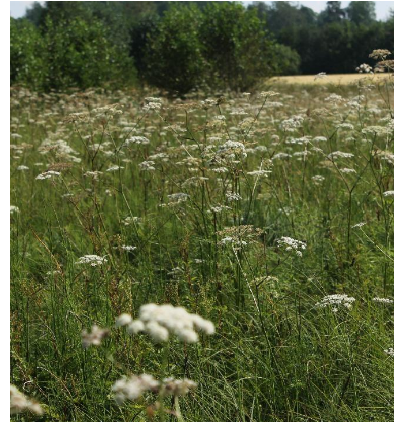
Kostea ruuhoniitty, Matalajärven eteläinen laidun.