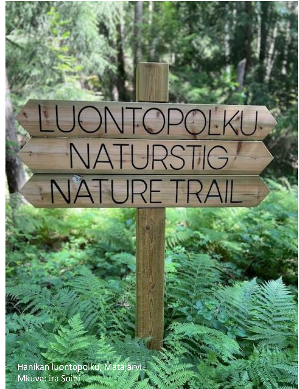
Hanikan luontopolku, Mätäjärvi.