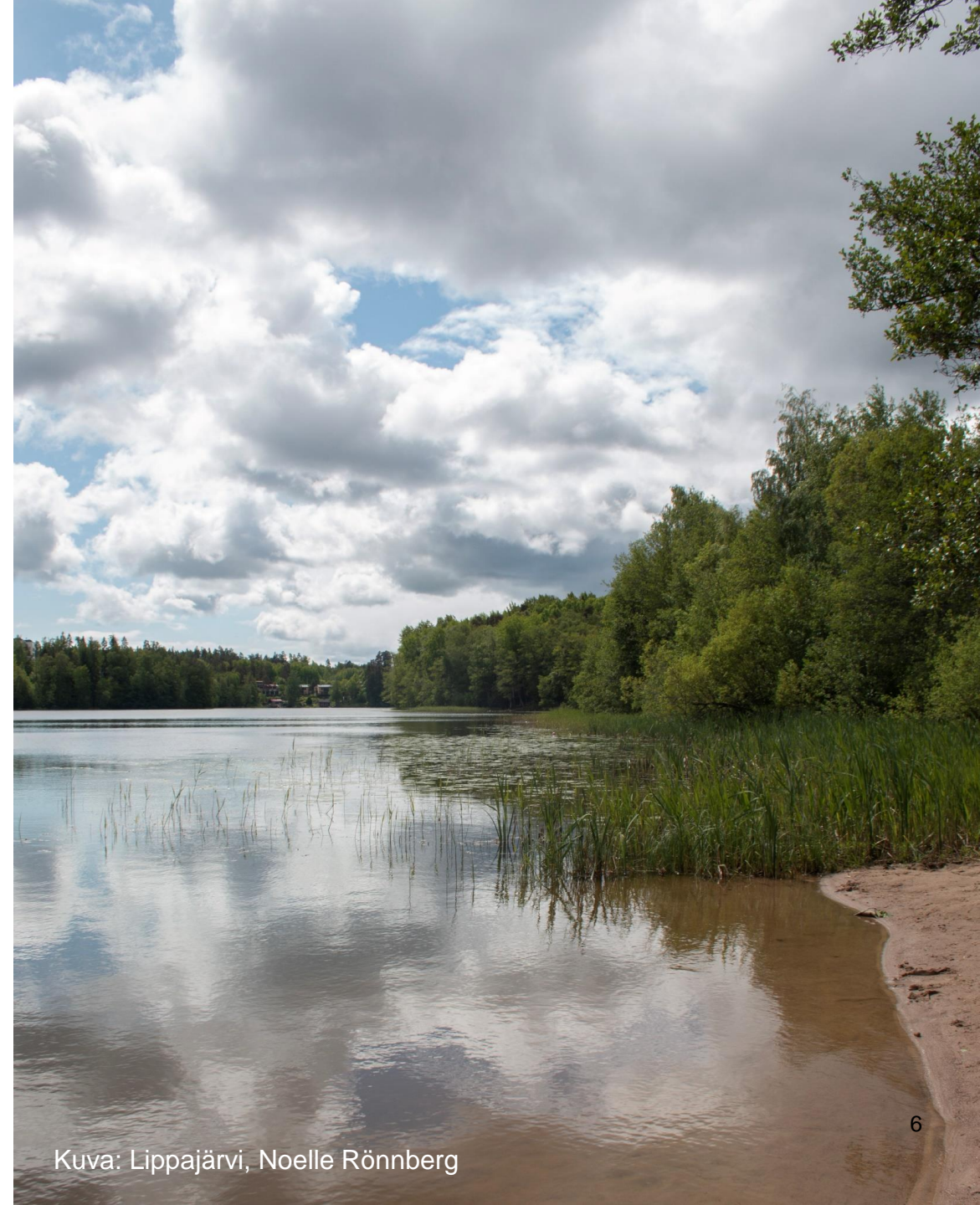
Kuva: Lippajärvi, Noelle Rönnerberg