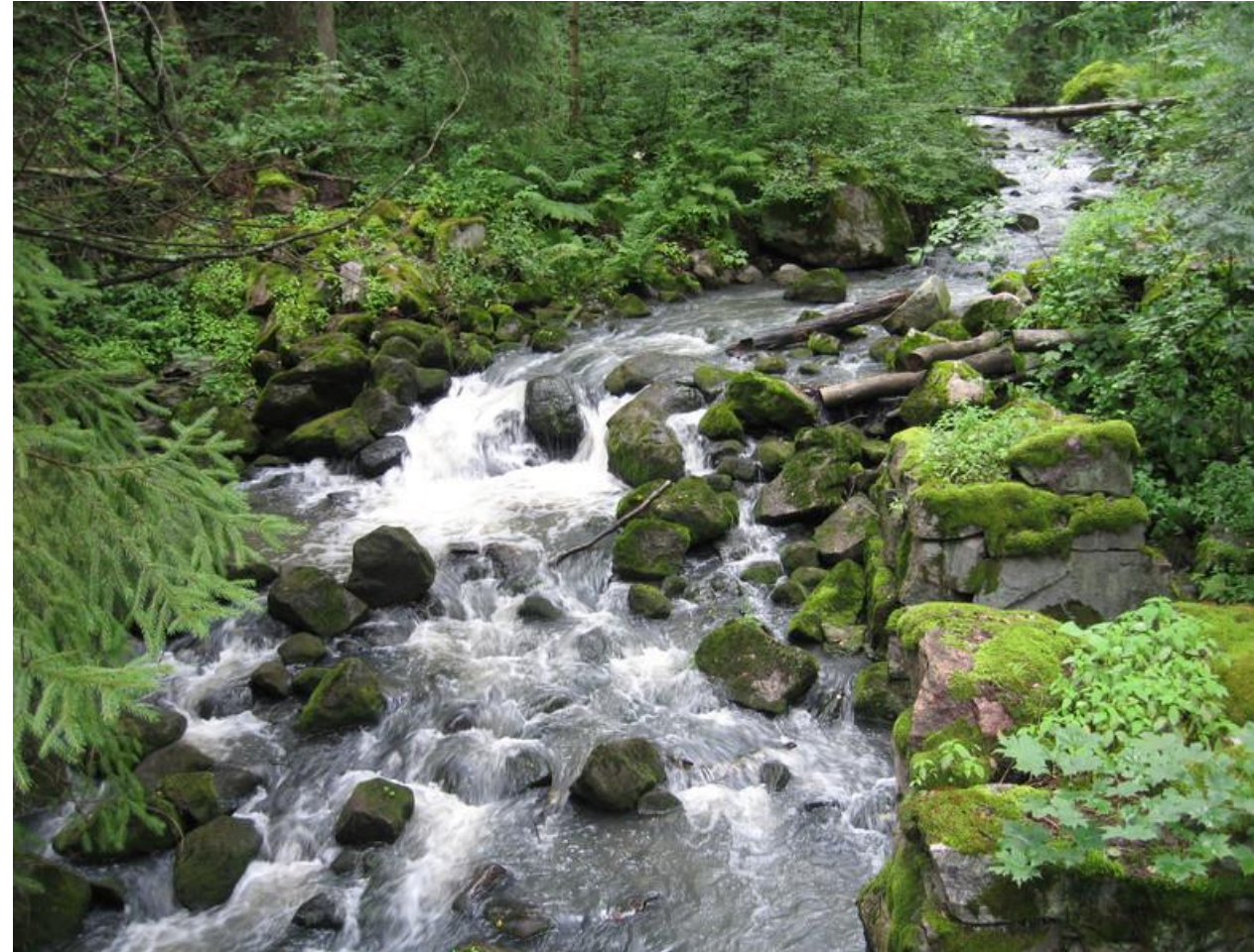
Kuva: Glomsinjoki Myllykoski, Espoon ympäristönsuojelu