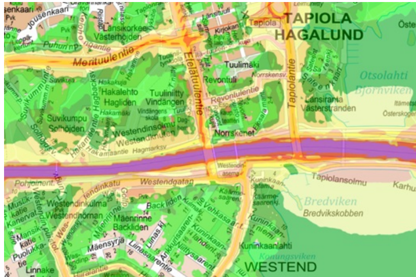
Kuva. Tieliikennemelu melumallinnuksen mukaan vuonna 2022

Kaupungin omassa meluntorjunnan toimintasuunnitelmassa esitetään toimenpiteitä meluntorjunnan tehostamiseksi sekä pitkän aikavälin tavoitteet. Toimenpiteet on määritelty seuraavaksi viideksi vuodeksi. Toimintasuunnitelmassa käsitellään pääasiassa pää- ja kokoojakatujen liikennettä. Näiden lisäksi osa toimenpiteistä liittyy maanteiden meluntorjuntaan, josta vastaavat pääosin Väylävirasto ja Uudenmaan ELY-keskus. Lisäksi suunnitelmaan on sisällytetty toimenpiteitä tapahtumien ja työmaiden meluntorjuntaan liittyen.