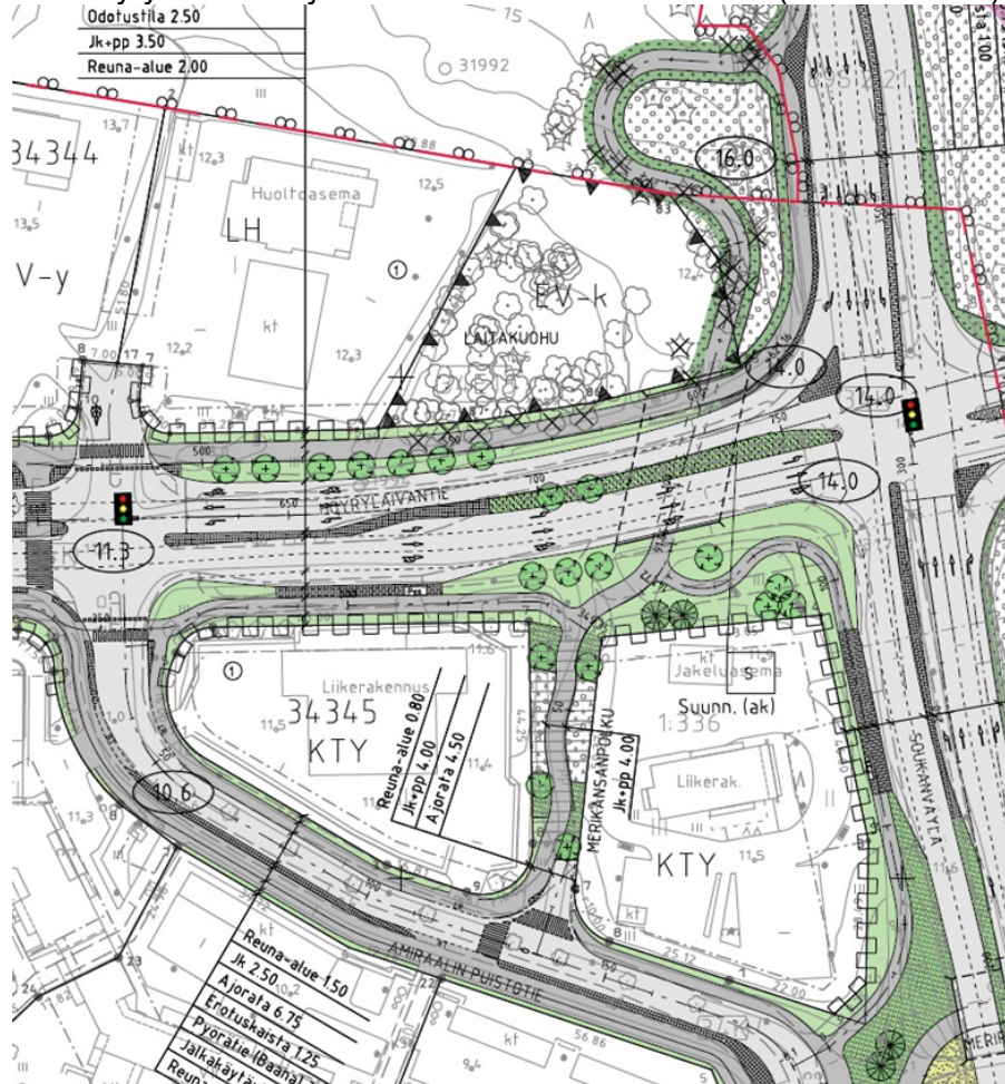
Ote Höyrylaivantien yleissuunnitelman luonnoksesta (Ramboll 2024):