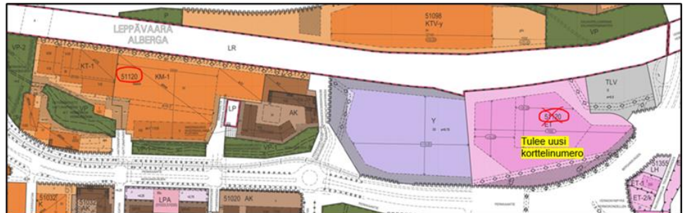
Ote ajantasa-asemakaavasta. Kortteli kahdessa osassa.