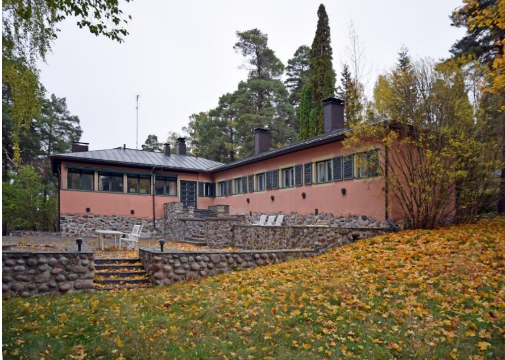
Villa Vinge etelästä, etualalla terassi ja taustalla loggia