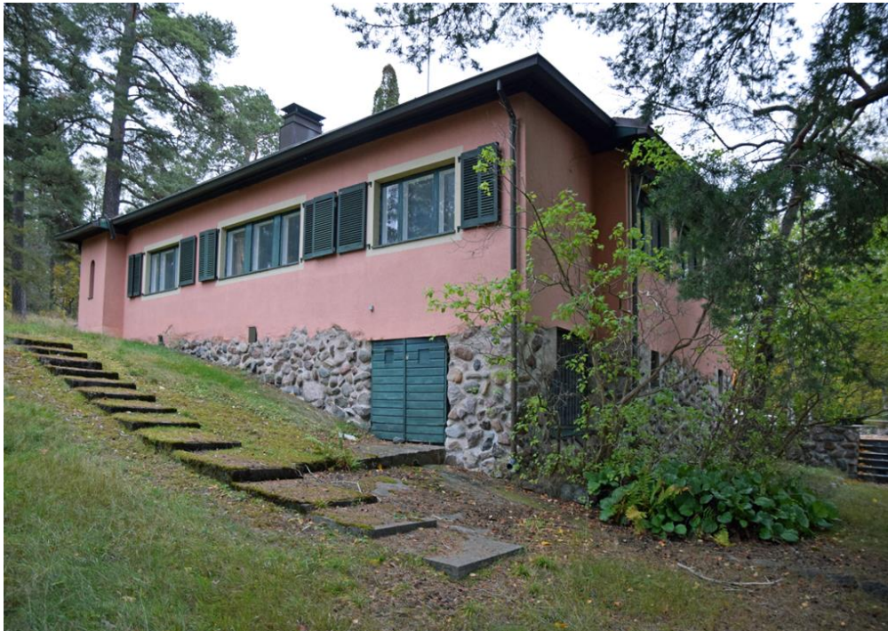
Huvilan pohjoispuoli. Pyöreät luonnonkivet on muistitietojen mukaan kerätty Espoonlahden ulkosaaristosta.