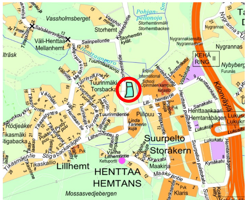
Kuva 1 Kaupan kohteen sijainti opaskartalla

Yksityisten omistamat kiinteistöt 49-419-2-57 ja 49-419-2-58 sijaitsevat Henttaalla Tuurinmäenlaidan asemakaavan alueella (kaavatunnus 331100). Asemakaavassa Storhementintien länsipuoleinen alue on osoitettu erillispientalojen korttelialueeksi ja itäpuoleinen alue on osoitettu asuinkerrostalojen korttelialueeksi. Kaava-alueen maankäyttösopimuskynnyksen ylittäneiden maanomistajien kanssa on solmittu maankäyttösopimukset lokakuussa 2022. Nämä kiinteistöjä 49-419-2-57 ja 49-419-2-58 koskevat sopimukset kohdistuvat pääosin asuinkerrostalokorttelin alueelle. Kaupunki omistaa ennestään noin puolet tästä asuinkerrostalokorttelista. Maankäyttösopimusten ehtojen mukaan sopimuskorvaukset eräänntyivät maksettaviksi viimeistään kolmen kuukauden kuluttua siitä, kun Tuurinmäenlaidan asemakaava sai lainvoiman.