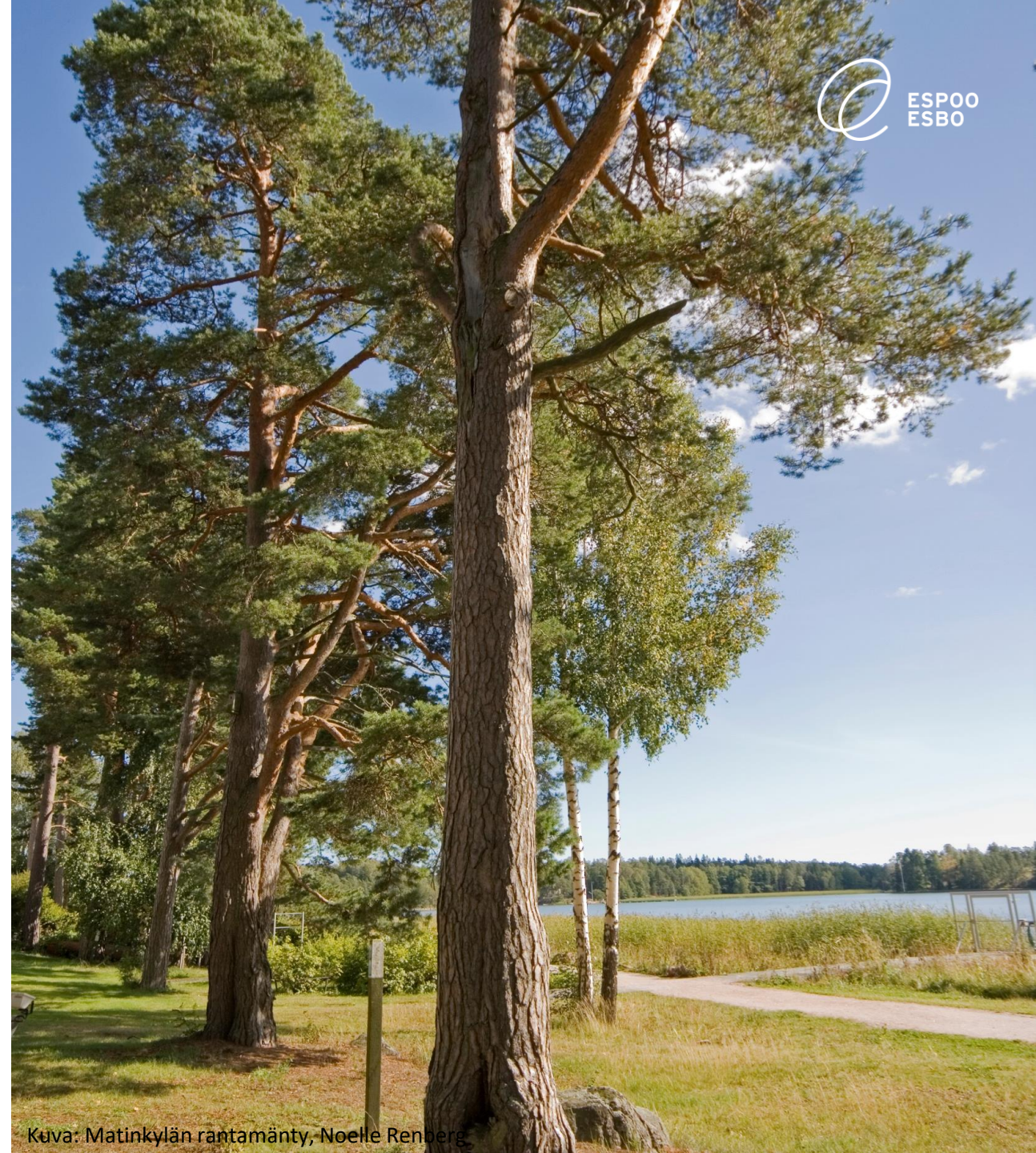
Kuva: Matinkylän rantamänty, Noelle Renberg