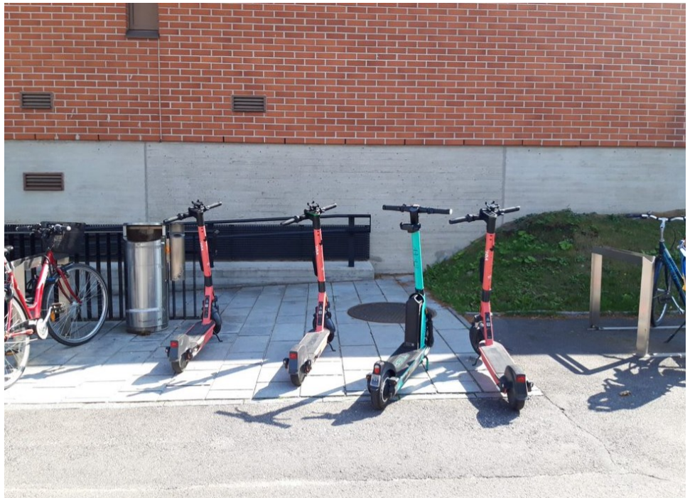
Kuva 2. Ennen sovellusohjauksen käyttöönottoa sähköpotkulaudat tukkivat mm. esteettömän reitin Otaniemen metrolle.