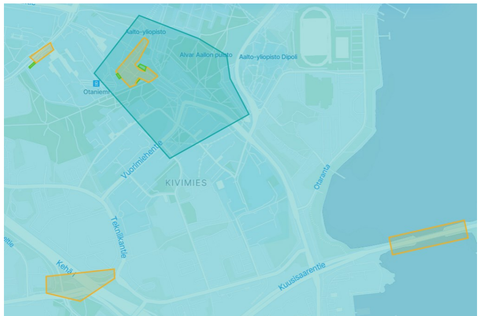
Kuva 3. Sähköpotkulautailua sovellusohjataan GPS-tekniologian avulla melko tehokkaasti. Pysäköintikieltoalueet (oranssi) sijaitsevat metroasemien sisäänkäyntien, alikulkutunnelien ja kapeiden siltojen yhteydessä. Metroasemien läheisyydessä sijaitsee suositeltuja pysäköintipisteitä (vihreä). Vilkkaalla kävelykampusalueella on voimassa nopeusrajoitus 15 km/h (sininen).