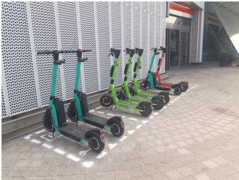
Kuva 4. Mm. Urheilupuiston metroasemalla pysäköintiä ohjataan sekä sovellusten että pysäköintiruutujen avulla. Kohde kuuluu Espoon kymmenen vilkkaimman lähtö- ja päätepisteen joukkoon.