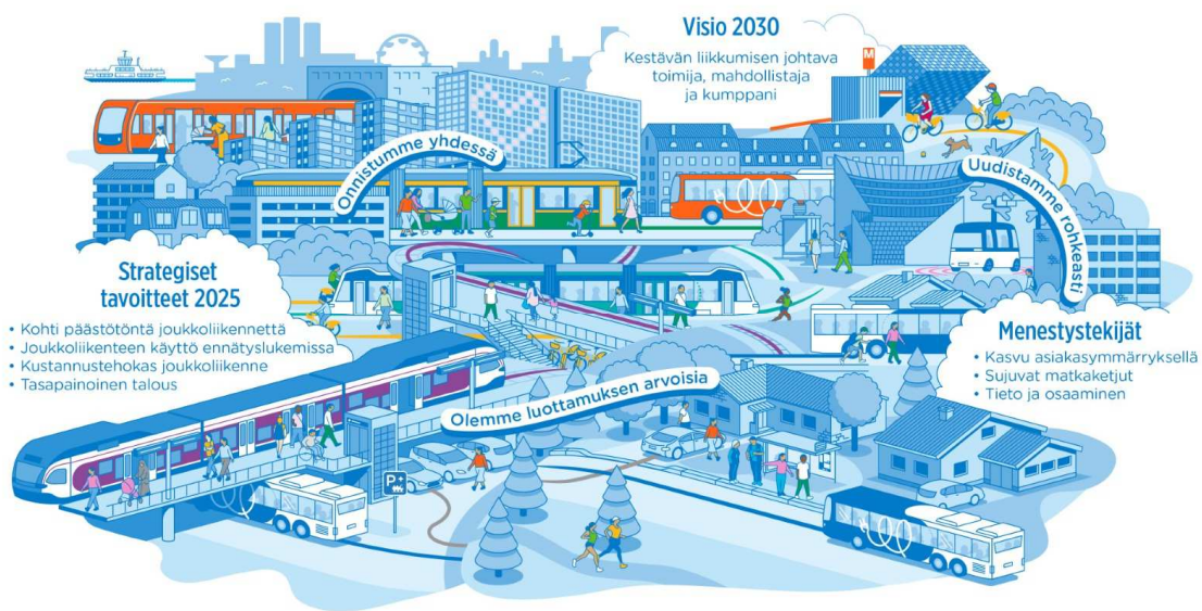
Kuvio 1: HSL:n strategia