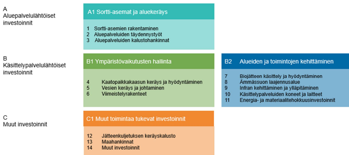
Kuva 1 Jätehuollon investointiohjelman korirakenne

Jätehuollon investointiohjelman rakenne perustuu korirakenteeseen, jossa investoinnit on jaettu kolmeen pääkokonaisuuteen ja 14 koriin. Pääkokonaisuudet ovat aluepalvelulähtöiset investoinnit, käsittelypalvelulähtöiset investoinnit ja muut investoinnit. Käsittelypalvelulähtöiset investoinnit jakaantuvat kahteen alakokonaisuuteen, jotka ovat ympäristövaikutusten hallinta sekä alueiden ja toimintojen kehittäminen. Jätehuollon investointiohjelman korirakenne on esitetty kuvassa 1.