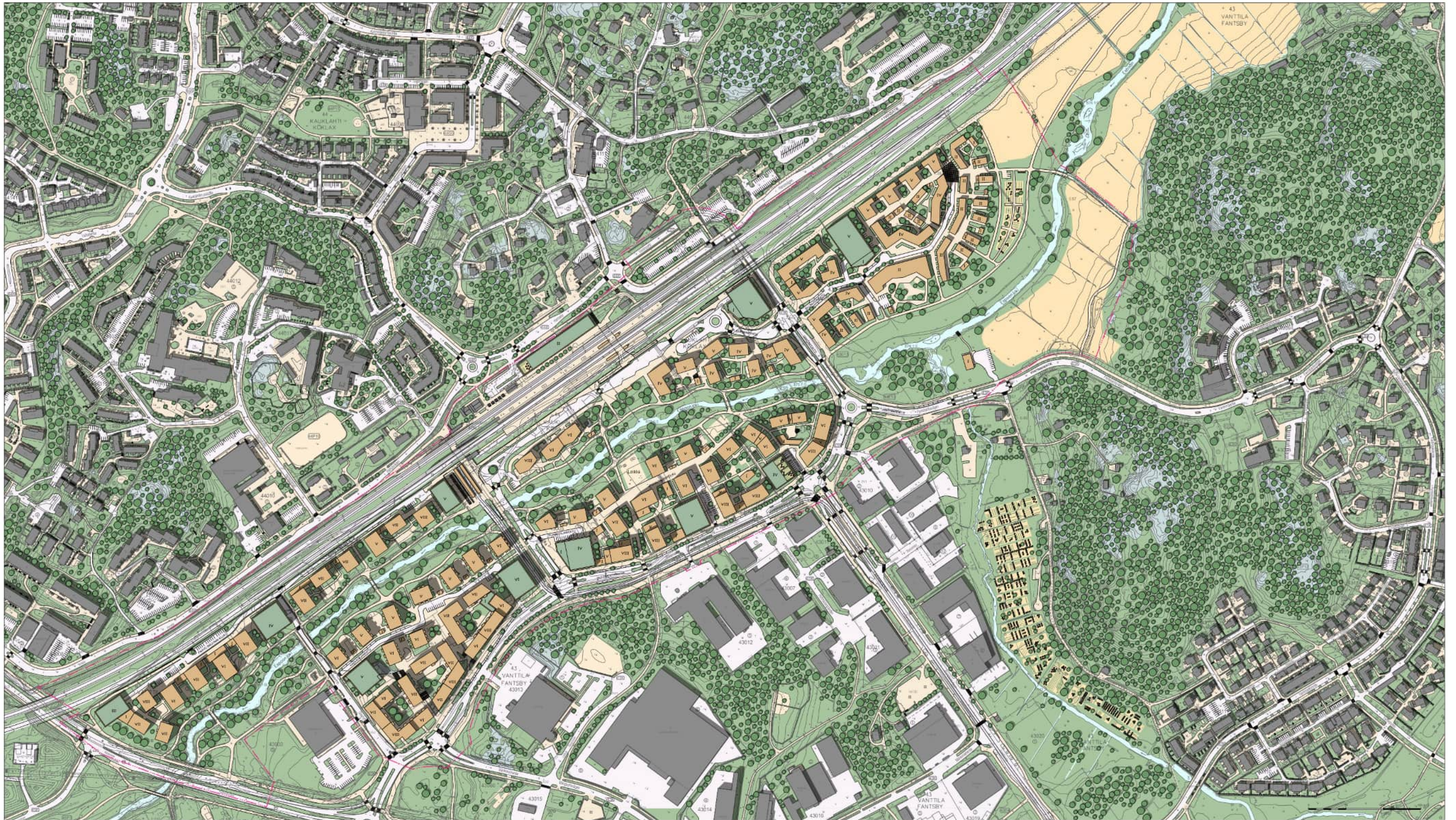
Liite 2: Havainnekuva (ei mittakaavassa)