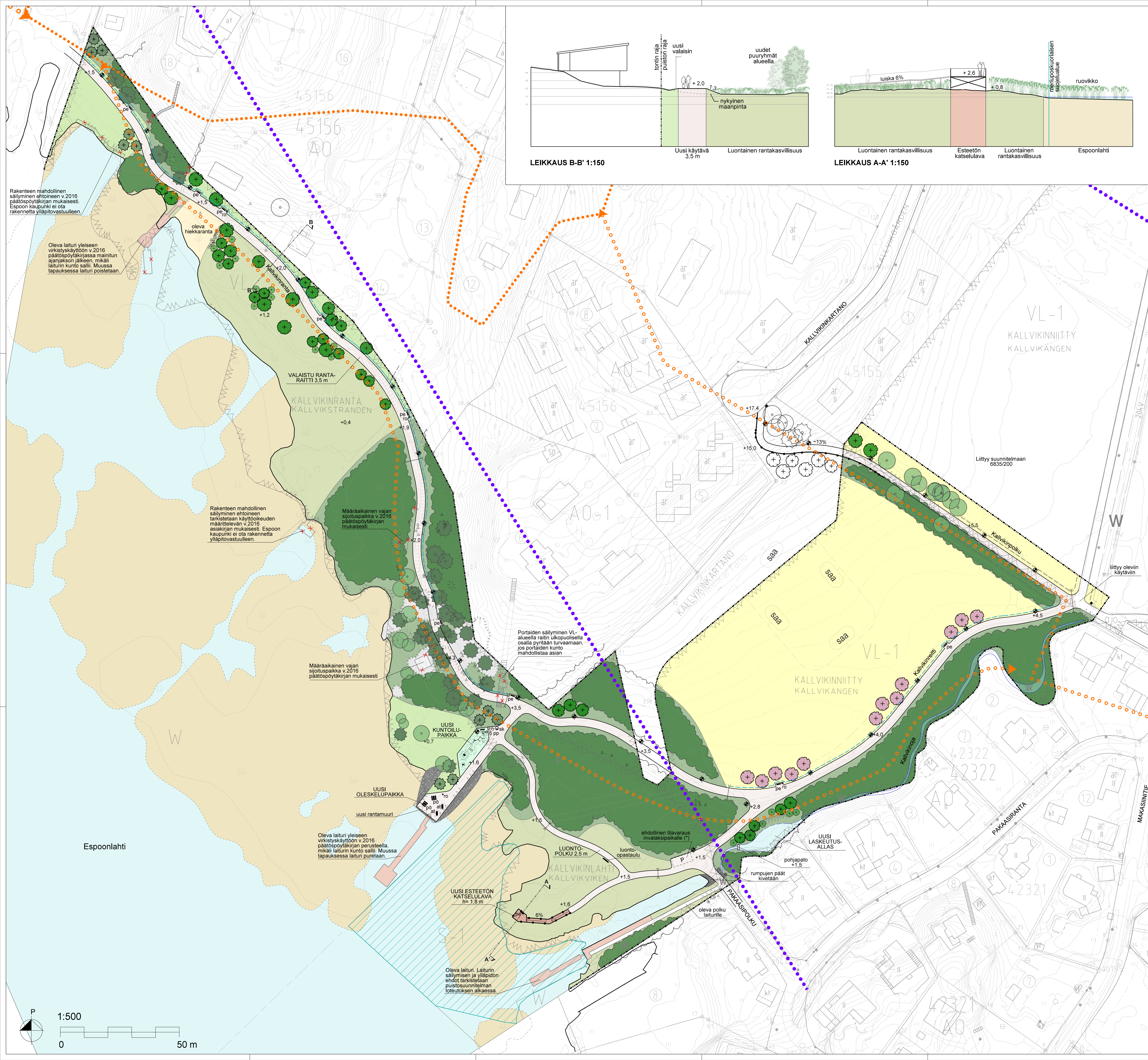
LEIKKAUS B-B' 1:150