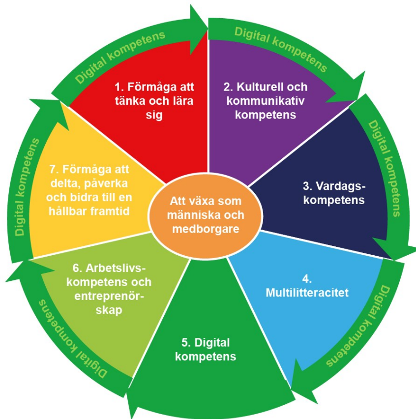
Bild 4 Mångsidig kompetens, betoning inom den grundläggande utbildningen på svenska i Esbo

Arrangemang och åtgärder med vilka skolan stöder att målen för mångsidig kompetens uppfylls: Skriv text här