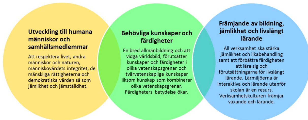
Bild 3 Sammanfattning av de nationella målen för undervisning och fostran

Utgående från målen i statsrådets förordning ska undervisningen ses som en helhet som ska utveckla sådan allmänbildning som behövs i den tid vi lever nu och som skapar grund för livslångt lärande. Utöver kompetens inom olika vetenskapsgrenar ska man sträva till en ämnesöverskridande kompetens.