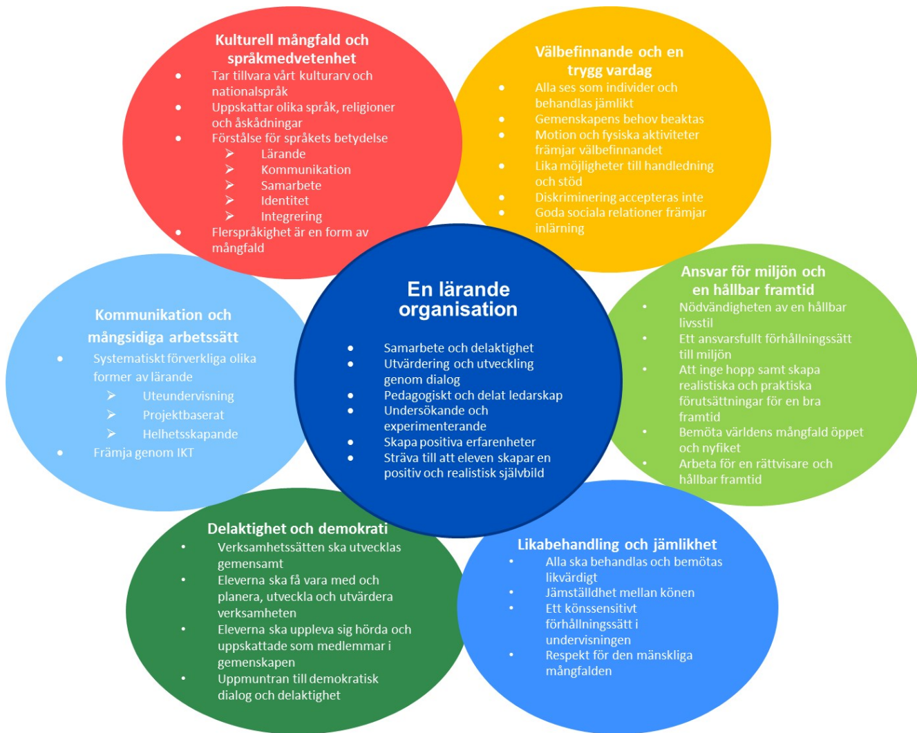
Bild 5 Sammanfattning av principerna för utvecklandet av verksamhetskulturen i grunderna för grundläggande utbildningens läroplan 2014

Utgångspunkten är en skola för alla elever. Eleverna erbjuds, i förhållande till sina förutsättningar, lämpliga utmaningar samt behövligt stöd för sitt lärande och sin utveckling. Verksamhetskulturen utvecklas så att varje barn har möjlighet att agera, utvecklas och lära sig som en unik individ och som medlem i gemenskapen. Alla som arbetar i skolan bär ansvar för elevens lärande och skolgång samt hens välmående i skolgemenskapen. Varje elev har rätt att må bra i sin skola.