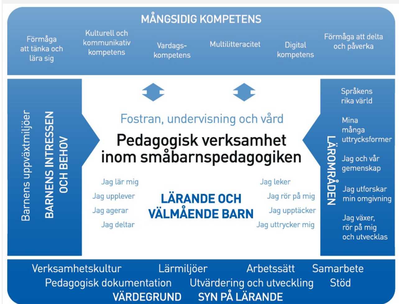
Figur 1. Referensram för den pedagogiska verksamheten

Den pedagogiska verksamheten inom småbarnspedagogiken ska präglas av ett helhetsskapande angreppssätt. Målet är att främja barnens lärande och välbefinnande samt mångsidiga kompetens (figur 1). Den pedagogiska verksamheten förverkligas i samverkan mellan barnen och personalen och i den gemensamma verksamheten. Barnens spontana verksamhet, personalens och barnens gemensamma idéer till verksamhet och verksamhet som planerats av personalen ska komplettera varandra. Den pedagogiska verksamheten inom småbarnspedagogiken ska genomsyra den helhet som består av fostran, undervisning och vård.