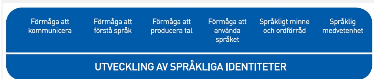
Figur 2. Språkutvecklingens centrala delområden inom småbarnspedagogiken

Med tanke på språkinläringen är det viktigt att vara medveten om att barn i samma ålder kan befinna sig i olika skeden av språkutvecklingen inom olika delområden. De språkliga identiteterna utvecklas när barnen får stöd och handledning inom de centrala delområdena för språkliga kunskaper och färdigheter.