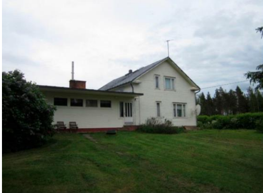
Kuva: Surullinen ja havainnollistava esimerkki laajennuksen vaikutuksesta Jaakkimantien talotyyppiin C ja D.

Muistutuksen mukaan talotyyppien C ja D laajennussuunnitelmiin tulee hakea esteettisesti ja arkkitehtonisesti kestävämpi ratkaisu. Tähän löytyy varmasti sopuisempia malleja vanhoista arkkitehtuurisuunnitelmista ja toteutuneista laajennuksista eri puolilta Suomea. Pelkkä rakennusoikeuden määrä (nyt 30 m 2 ) ei saa olla ohjaava tekijä.