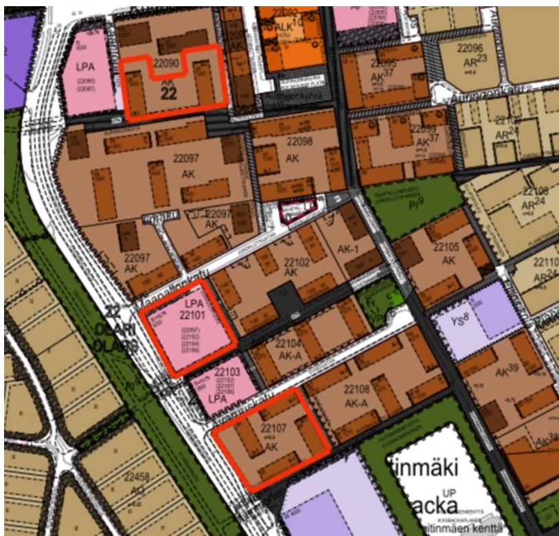
Ote voimassa olevasta asemakaavasta.