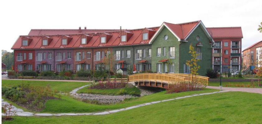
Kuva 1. Useammassa muistutuksessa esitetty kuva Kartanonkoskelta, mitä pidettiin viihtyisänä asuinalueena.

Vantaan Kartanonkoski nostettiin malliesimerkkinä viihtyisästä matalasta ja tiivisrakentamisesta. Kartanonkosken rakennustapaa pidettiin kauniina ja tehokkaana, ja vastaavanlainen rakentaminen nähtiin soveltuvan myös asemakaavan muutosalueelle.