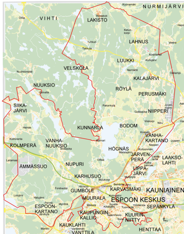
Suunnittelualueen likimääräinen sijainti Espoon opaskarttopohjalla