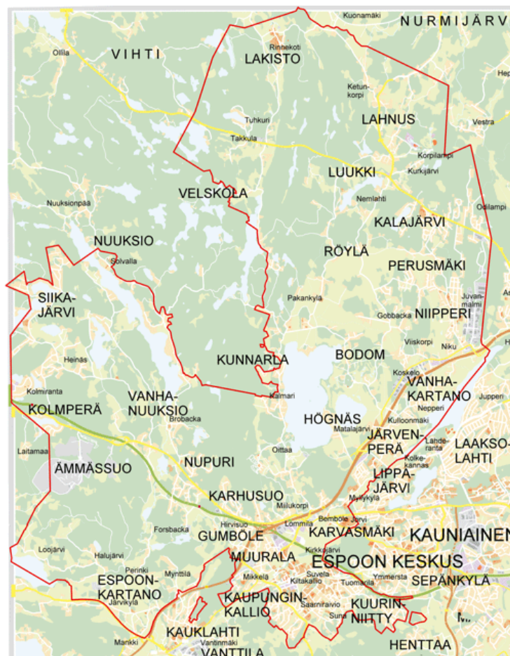
Suunnittelualueen likimääräinen sijainti Espoon opaskarttapohjalla

Hyväksymiskäsittelystä pois rajatuilla alueilla ei ole Myntinmäkeä lukuun ottamatta merkittävää vaikutusta Espoon pohjois- ja keskiosien työpaikkakehitykseen. Aiemman kaavaehdotuksen mukaiset 10 000 Myntinmäen asukasta olisivat synnyttäneet noin 450 työpaikkaa yksityisten ja julkisten palveluiden pariin. Tämän alueen maankäyttöratkaisu voidaan hyväksyä vasta uuden maakuntakaavan voimaantultua. Espoon keskuksen ja Lommilan työpaikkakehitys mahdollistuu samassa mittakaavassa myös voimassa olevalla yleiskaavalla.