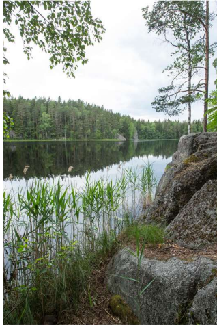
Haukkalampi, Nuksio

Tarkastuslautakunta on osallistunut vuosittain pääkaupunkiseudun kaupunkien ja Helsingin ja Uudenmaan sairaanhoitopiirin arviointiyhteistyöhön. Ulkoisten tarkastustoimien viranhaltijoiden yhteisarviointiryhmän ohjausryhmänä toimivat tarkastuslautakuntien puheenjohtajat. Keväällä 2020 julkaistiin yhteisarviointiraportti aiheesta toimiiko sähköinen asiointi terveyspalveluissa sujuvasti ja vastaako sähköinen asiointi laadukkaasti ja vaikuttavasti kunta-laisten tarpeisiin.