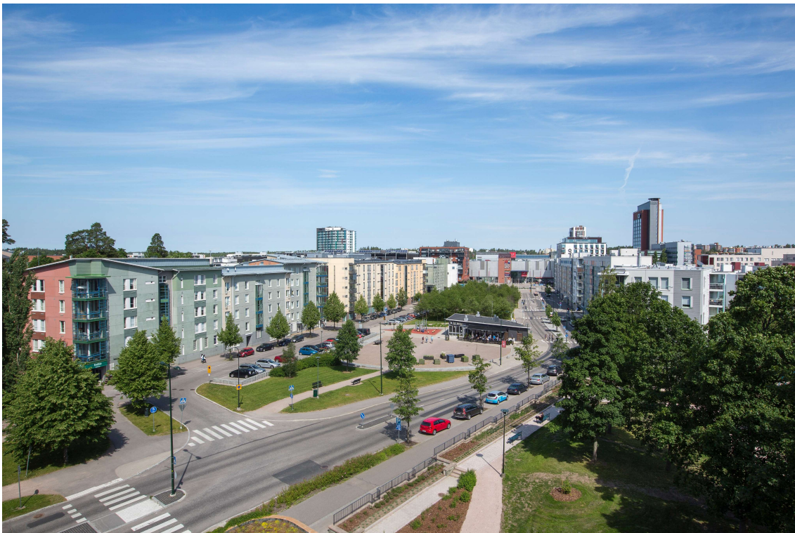
Arviointikertomuksesta poimittu kuva Leppävaarasta kesällä 2019