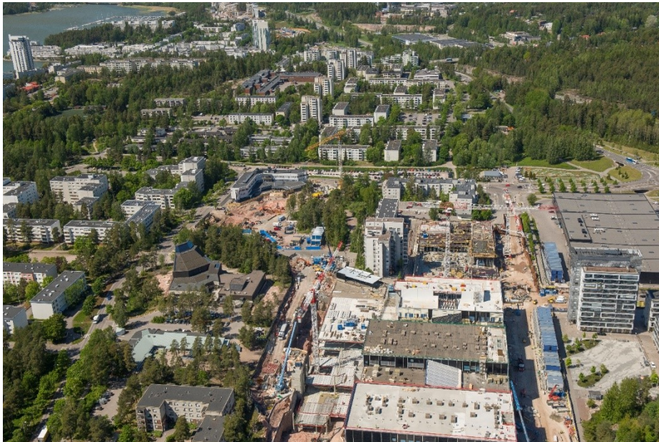
Ilmakuva Espoonlahdesta, Lippulaiva

Koronaviruspandemian raportoidaan aiheuttaneen viiveitä muun muassa hissien ja liukuportaiden asennuksiin ja joidenkin materiaalien toimituksiin. Lisäksi asemien rakennusurakoiden toteutuksessa raportoidaan olevan asemakohtaisia viiveitä 0 – 4 kuukautta, mutta näiden viiveiden ei ole raportoitu vaikuttavan kokonaisuikataulun toteutumiseen.