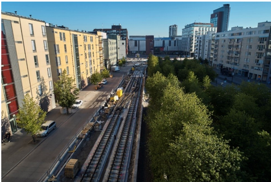
Raide-Jokerin raiteiden rakentamista Leppävaarassa elokuussa 2020

Kiinteiden rakenteiden ja laitteiden infrastruktuurin rakentamisolosuhteiden raportoidaan olleen vuoden 2020 aikana poikkeuksellisen hyvät. Leuto sää on mahdollistanut täysimääräisen työmailla työskentelyn ja koronaviruksen aiheuttama liikenteen vähäneminen on auttanut urakoiden etenemisessä.