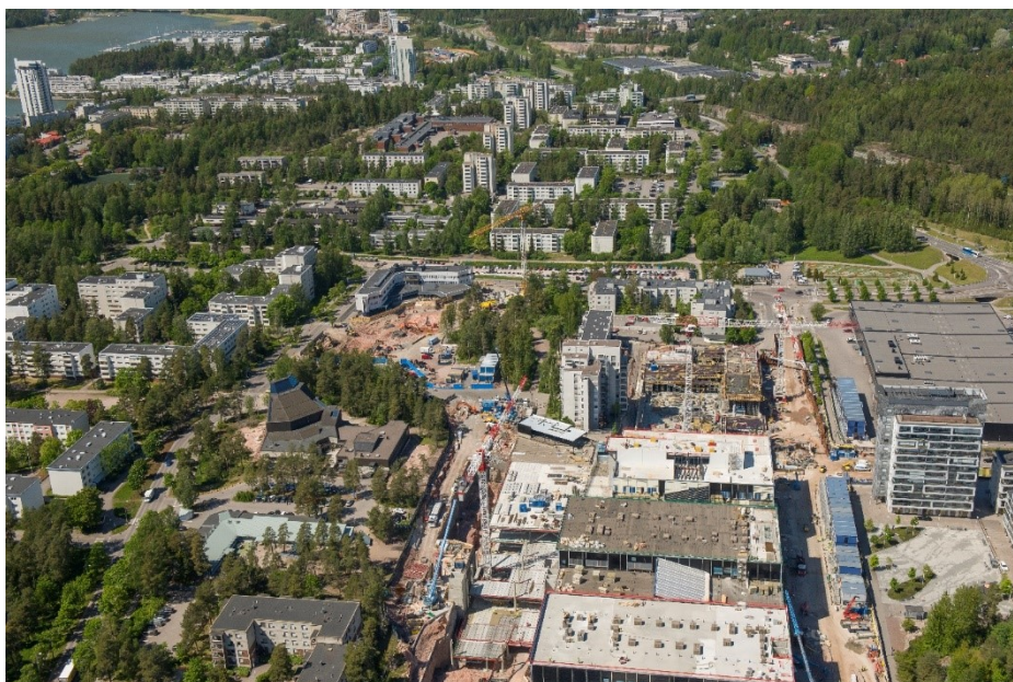
Ilmakuva Espoonlahdesta, Lippulaiva

Koronaviruspandemian raportoidaan aiheuttaneen viiveitä muun muassa hissien ja liukuportaiden asennuksiin ja joidenkin materiaalien toimituksiin. Lisäksi asemien rakennusurakoiden toteutuksessa raportoidaan olevan asemakohtaisia viiveitä 0 – 4 kuukautta, mutta näiden viiveiden ei ole raportoitu vaikuttavan kokonaisaikataulun toteutumiseen.