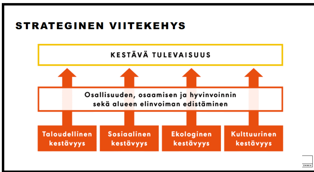
Kuvio 1. Omnian strateginen viitekehys

Omnian strateginen viitekehys on esitetty kuviossa 1.